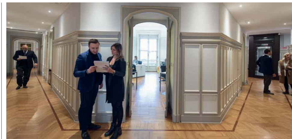
Agenzia di Torino

di lavorare, in termini sia di processi che di prodotti e servizi offerti ai nostri soci assicurati».